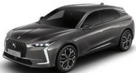
Šedá Platinum (M) MOVL