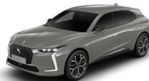
Šedá Lacquered (M) MOSC