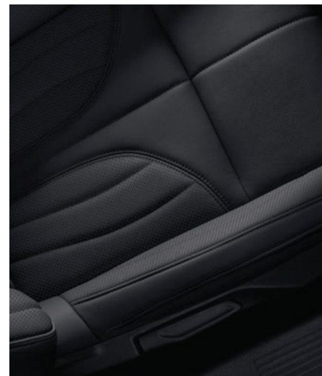
Tlačená černá kůže Basalte