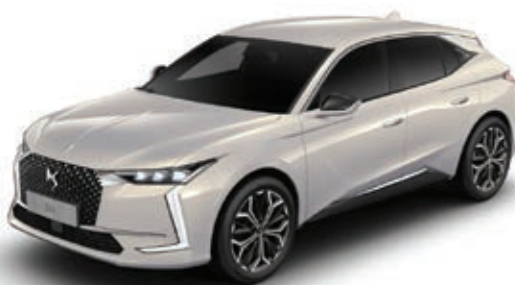
Bílá Cristal Pearl (M) MOPH