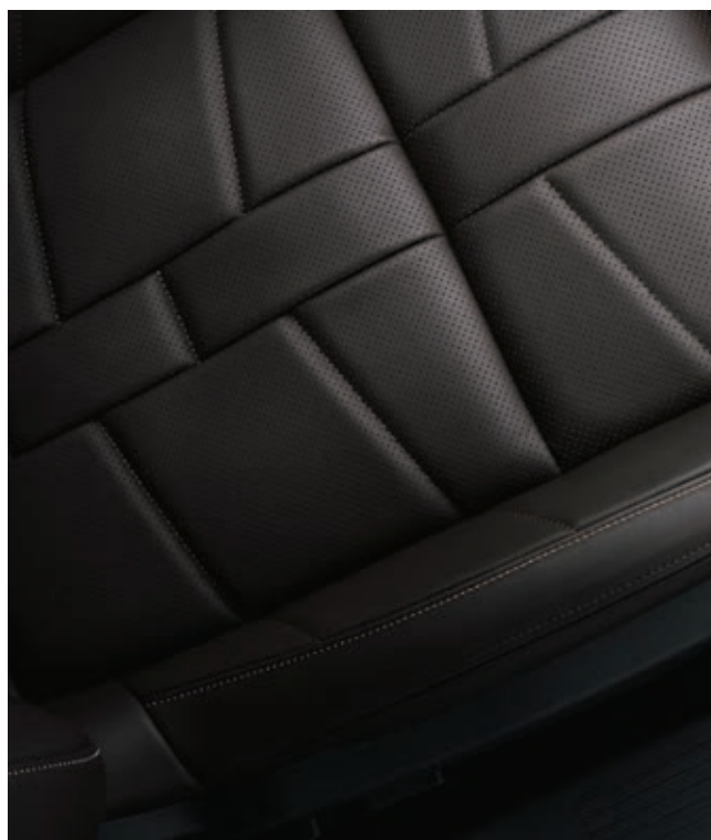
Hnědá kůže Criollo v provedení Bracelet