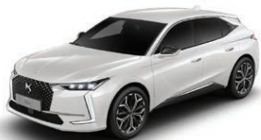
Bílá Nacré (P) M6N9