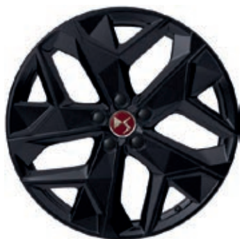
Hliníková kola 19" MINNEAPOLIS