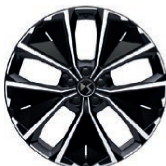
Hliníková kola 20" SYDNEY