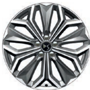
Hliníková kola 19" FIRENZE