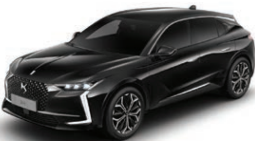
Černá Perla Nera (M) M09V

(M) : Metalická barva – (P) : Perleťová barva