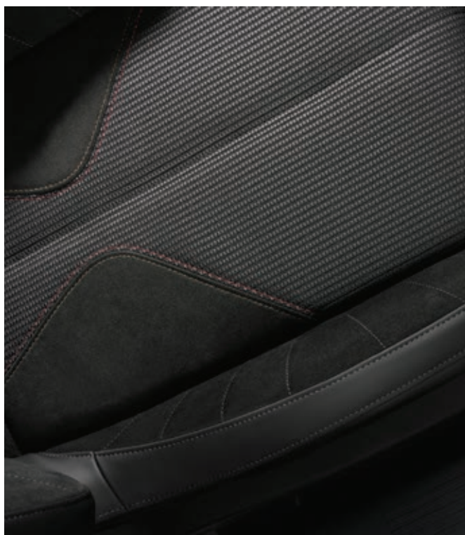
Kombinované textilní čalounění s Alcantarou® PERFORMANCE LINE