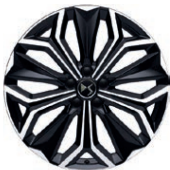
Hliníková kola 19" SEVILLA